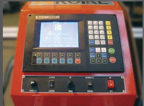
《 고이케 D410 콘트롤러 》